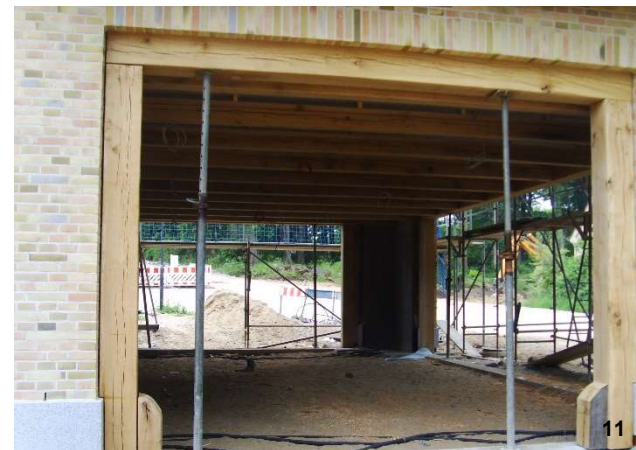
Bildverzeichnis: 1. Google Earth Gut Weissenhaus 2. Schloss Weissenhaus 3. Blick vom SPA aufs Schloss 4. Lageplanausschnitt 5. Wiederaufbau der Scheune 6. Neubau Torhaus 7. Restaurant am Strand 8. Prinzipdarstellung Senkkasten 9. Herstellung Tunnel Schloss - SPA 10. SPA Innen- und Außenansicht 11. Toreinfahrt Remise